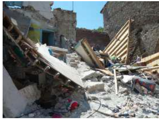
Οικία στη Βρίσα όπου έγινε επιχείρηση έρευνας - διάσωσης από το Π.Σ.