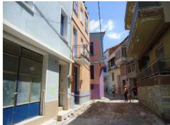
Πεσμένα Δομικά Υλικά σε δρόμο στο Πλωμάρι