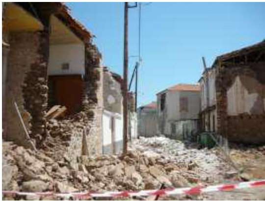
Διαδοχικές Ολικές καταρρεύσεις στη Βρίσα