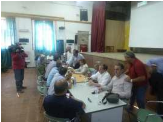
Σύγκληση Συντονιστικού Οργάνου Πολιτικής Προστασίας μετασεισμικά στο Πολυκέντρο Πολιχνίτου