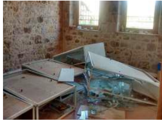
Μη δομικές αστοχίες στο Μουσείο Φυσικής Ιστορίας στη Βρίσα