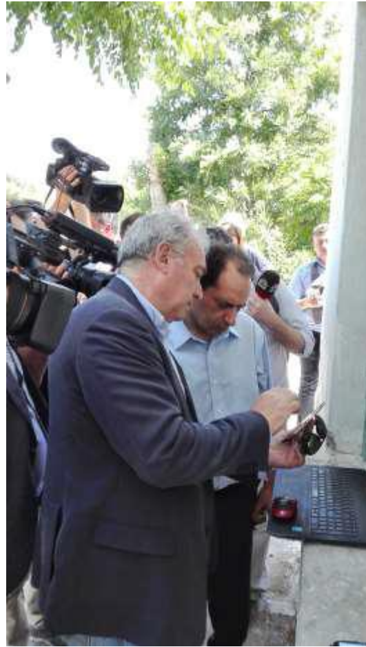
Ενημέρωση του Υπουργού Υποδομών και Μεταφορών Χ. Σπίρτζη από τον Πρόεδρο του ΟΑΣΠ Καθηγητή Ε. Λέκκα