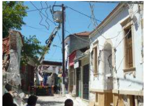
Άρση επικινδυνότητας μετασεισμικά στη Βρίσα