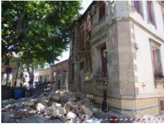
Δομικές Αστοχίες σε οικία στην πλατεία του χωριού Ακράσι