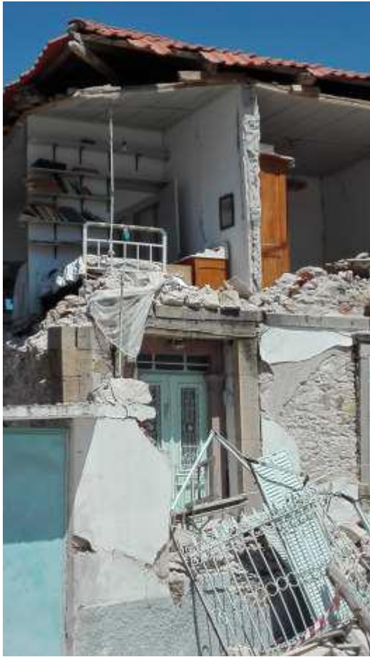
Μερική κατάρρευση σε οικία στη Βρίσα