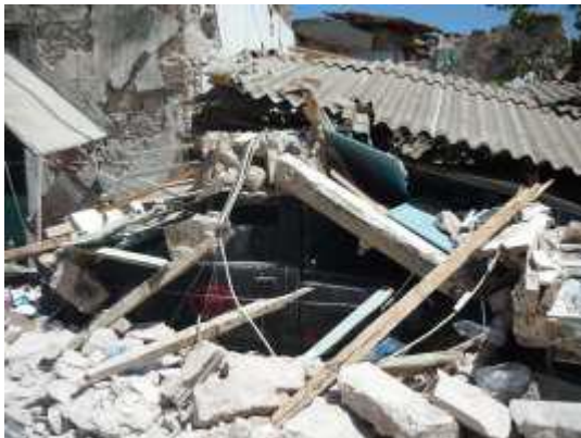
Ζημιές σε Ι.Χ. σε δρόμο στη Βρίσα