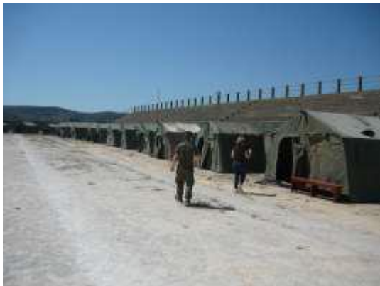
Καταυλισμός σκηνών στο γήπεδο Πολιχνίτου