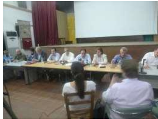
Συνέντευξη τύπου στο Πολυκέντρο Πολιχνίτου παρουσία του Υπουργού Υποδομών και Μεταφορών Χ. Σπρίτζη