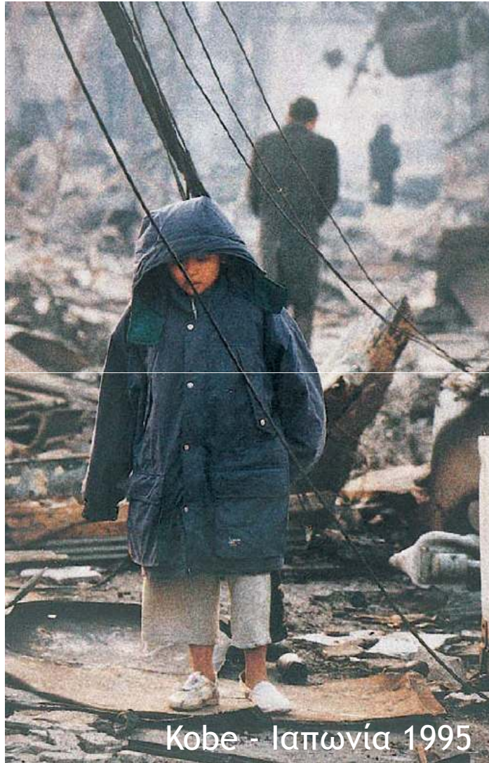
Kobe - Ιαπωνία 1995