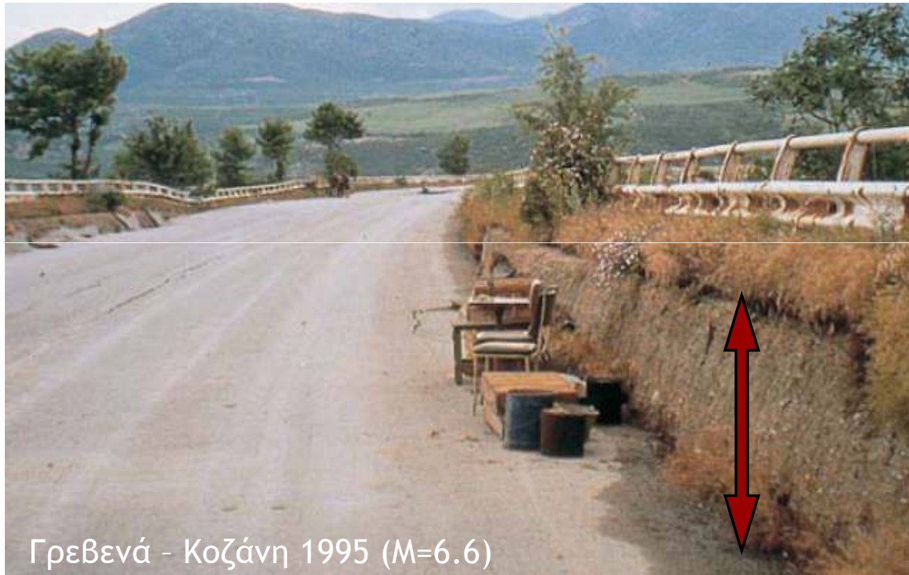
Γρεβενά - Κοζάνη 1995 (M=6.6)