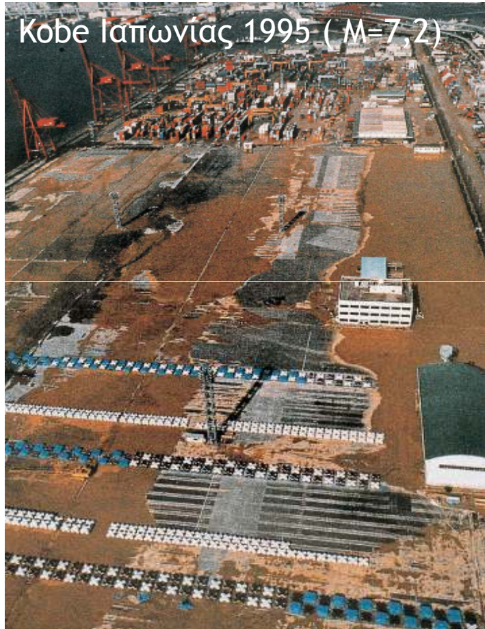
Εκτεταμένες ρευστοποιήσεις εδαφών (καφέ χρώμα) στο λιμάνι του Kobe