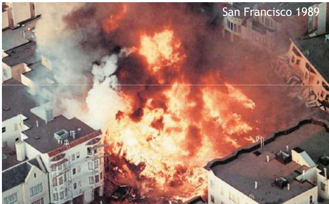
San Francisco 1989