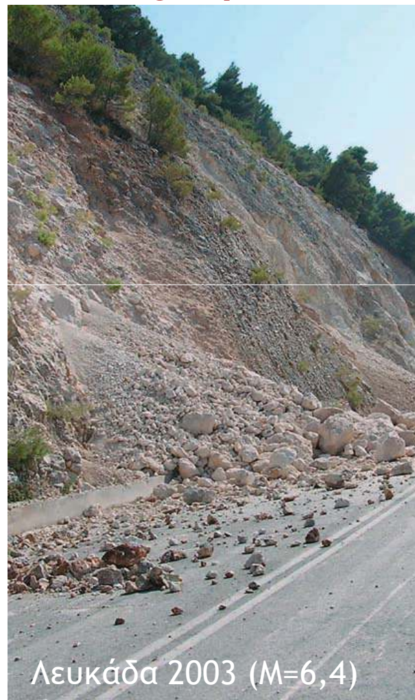
Λευκάδα 2003 (M=6,4)