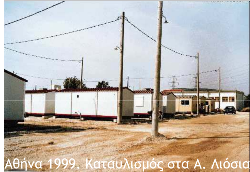
Αθήνα 1999. Καταυλισμός στα Α. Λιόσια

Προσωρινοί καταυλισμοί, στέγαση σε σκηνές ή ημιμόνιμα καταλύματα