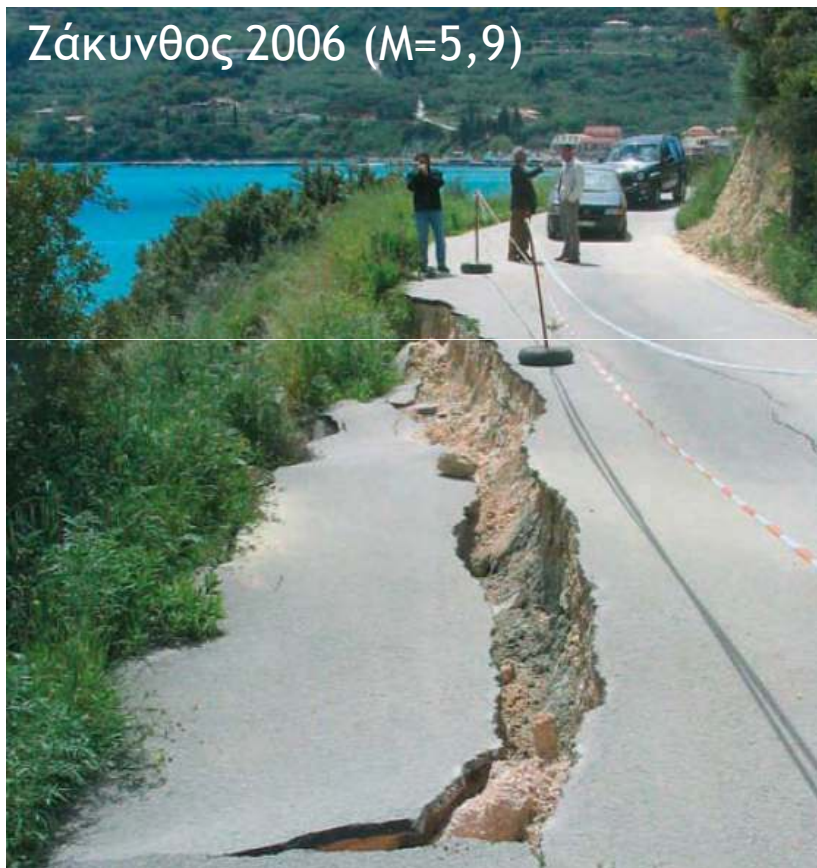
Ζάκυνθος 2006 (M=5,9)