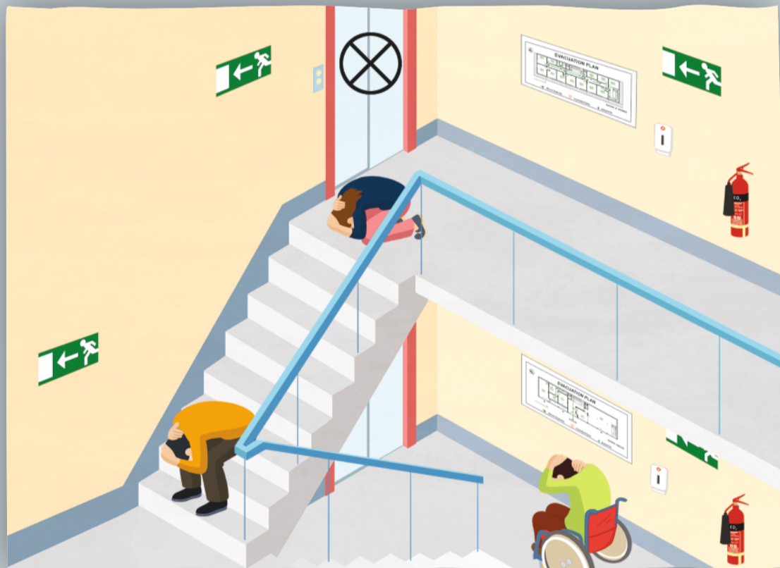
Не двигайтесь. Уменьшите ваш рост и защитите себя