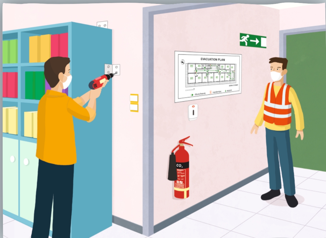
Определите и постарайтесь уменьшить опасность