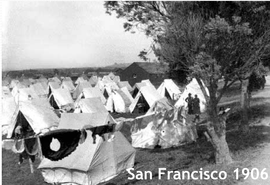
San Francisco 1906

Οι σκηνές, τα τροχόσπιτα και τα κρουαζιερόπλοια είναι σε πολλές περιπτώσεις η πρώτη λύση για την άμεση στέγαση των πληγέντων.