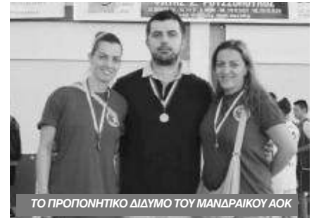
ΤΟ ΠΡΟΠΟΝΗΤΙΚΟ ΔΙΔΥΜΟ ΤΟΥ ΜΑΝΔΡΑΙΚΟΥ ΑΟΚ