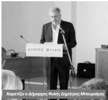
Χαιρετίζει ο Δήμαρχος Φυλής Δημήτρης Μπουραϊμής

Ο δήμαρχος Φυλής Δ. Μπουραϊμής αναφέρθηκε και αυτός με τη σειρά του στην ανεξίτηλη αποτύπωση του σεισμού του 1999 στη μνήμη όλων και ευχήθηκε να μην ξαναζήσουμε τέτοιο φυσικό φαινόμενο, έστω και αν στην πράξη δεν είναι στο χέρι κανενός να το αποφασίσει, γεγονός που καθιστά έκδηλη την αναγκαιότητα της συγκεκριμένης ημερίδας για την αντιμετώπισή του. Επιβρόβησε δημοσίως τον επικεφαλής δημοτικής παράταξης κ. Σ. Σάββα για την αυτοθυσία που επέδειξε στο σεισμό, όπως και άλλων συμπολιτών και χαρακτήρισε την ανάπλαση που ξεκίνησε τότε από τη δημοτική αρχή ως τη μεγαλύτερη που έχει γίνει συγκρινόμενη με άλλες αντίστοιχες περιπτώσεις.