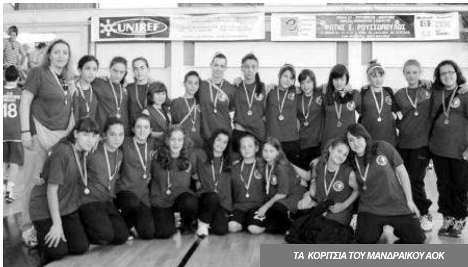
ΤΑ ΚΟΡΙΤΣΙΑ ΤΟΥ ΜΑΝΔΡΑΙΚΟΥ ΑΟΚ