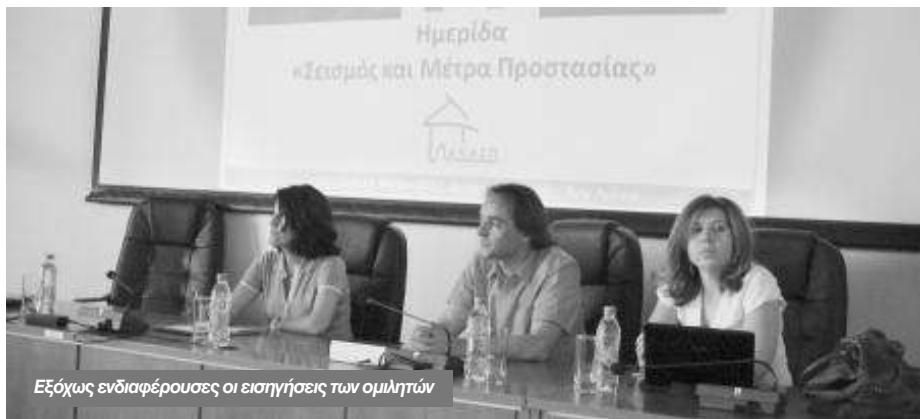
Εξόχως ενδιαφέρουσες οι εισηγήσεις των ομιλητριών