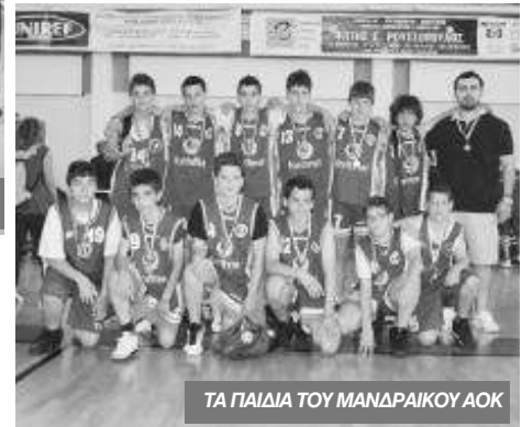
ΤΑ ΠΑΙΔΙΑ ΤΟΥ ΜΑΝΔΡΑΙΚΟΥ ΑΟΚ