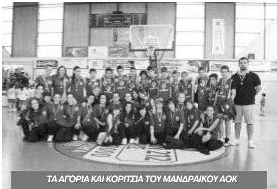
ΤΑ ΑΓΟΡΙΑ ΚΑΙ ΚΟΡΙΤΣΙΑ ΤΟΥ ΜΑΝΔΡΑΙΚΟΥ ΑΟΚ