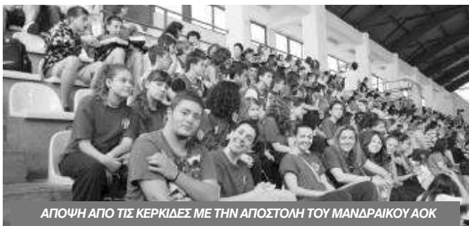
ΑΠΟΨΗ ΑΠΟ ΤΙΣ ΚΕΡΚΙΔΕΣ ΜΕ ΤΗΝ ΑΠΟΣΤΟΛΗ ΤΟΥ ΜΑΝΔΡΑΙΚΟΥ ΑΟΚ

Τέτοια γεγονότα έχουν επιτυχία όταν υπάρχει σωστή οργάνωση και προσέλευση και η εκδήλωση τα είχε όλα σε υπερθετικό βαθμό.